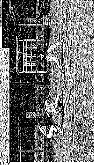
珍客も歓迎してくれました