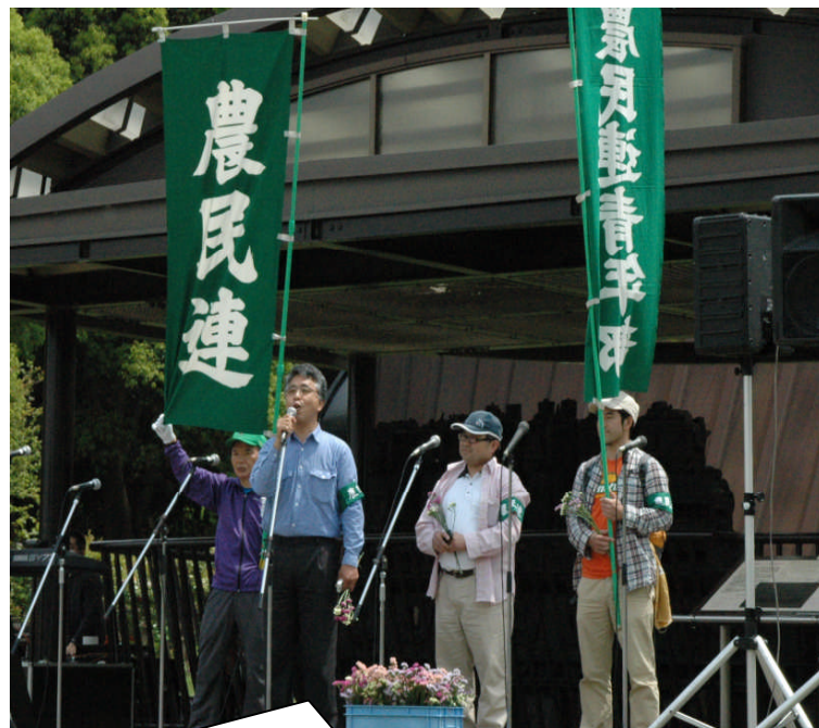
5・6集会に南相馬市の農業を営んでいる農民連の代表が原発の惨事を訴えている