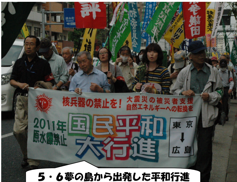
5・6夢の島から出発した平和行進