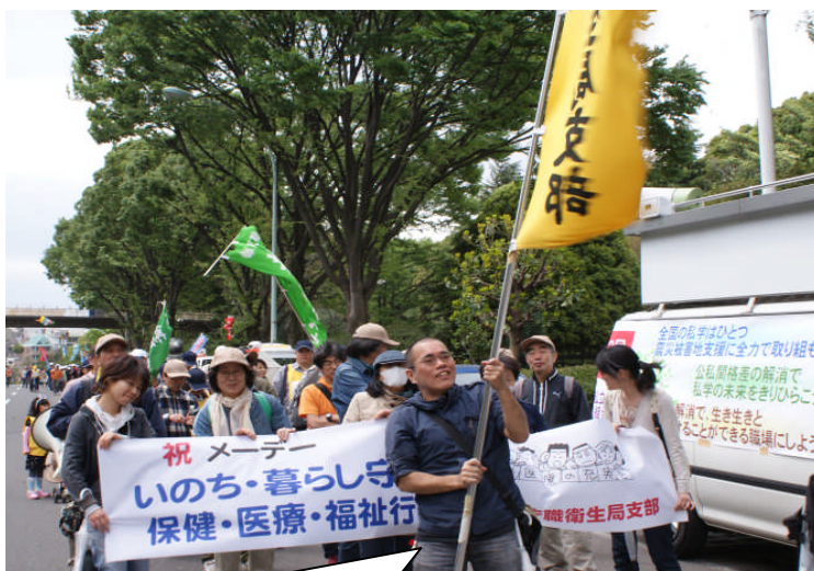
元気よく行進している北療分会の新入組合員

メーデーは、「労働者の日」といわれ、1886年5月1日、アメリカ合衆国シカゴで8時間労働制要求の統一ストライキを行った日が起源となっています。 日本での第1回メーデーは、1920年5月2日上野公園で行われ、およそ1万人が「8時間労働制の実施」「失業の防止」「最低賃金法の制定」などを訴えて行われました。 このスローガンは、現在の状況にピッタリとあてはまる今日の課題でもあります。