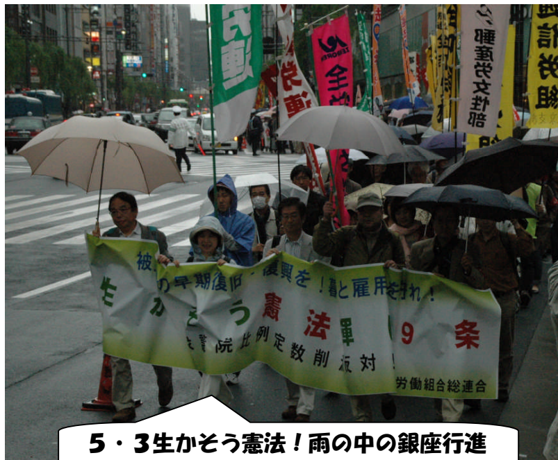
5・3生かそう憲法！雨の中の銀座行進

メーデーは、「労働者の日」といわれ、1886年5月1日、アメリカ合衆国シカゴで8時間労働制要求の統一ストライキを行った日が起源となっています。 日本での第1回メーデーは、1920年5月2日上野公園で行われ、およそ1万人が「8時間労働制の実施」「失業の防止」「最低賃金法の制定」などを訴えて行われました。 このスローガンは、現在の状況にピッタリとあてはまる今日の課題でもあります。